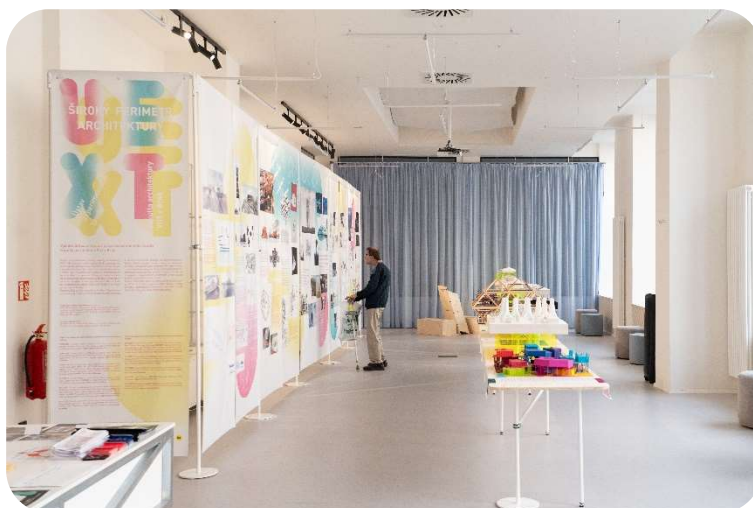
Expozici tvoří originální modely, informace o projektech i audiovizuální prvky