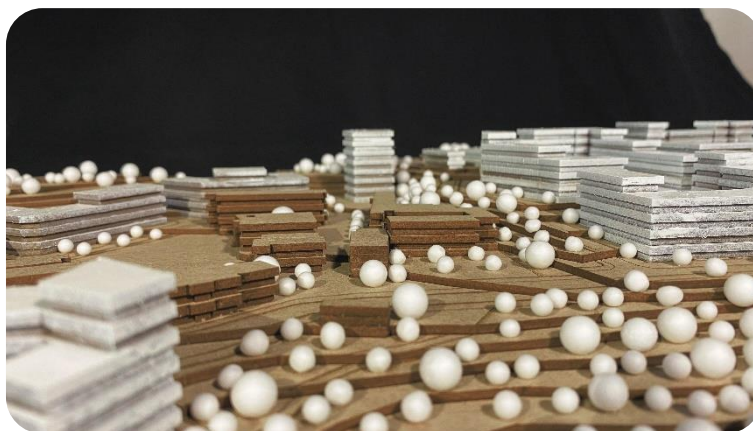
Foto modelu řešené oblasti